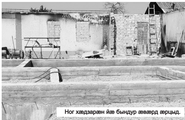
Ног хæдзарæн йæ бындур æвæрд æрцыд.

кæстæры æгъдауæй. Бахъомыл сты йæ кæстæртæ, сты æмгарджын, фæллойуарзæг æмæ æгъдауыл хæст. "Искæмæн иу мисхалы бæрц цин æрхæссын,